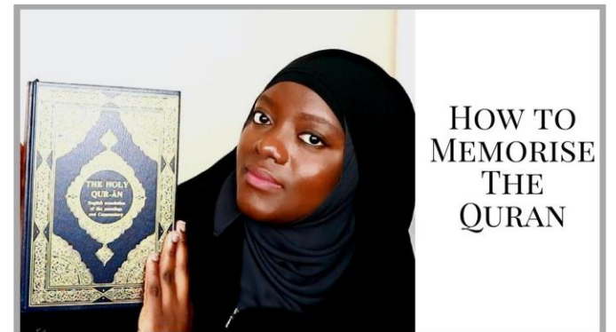
Kanal: "Nafisa's Pearls" (UK)