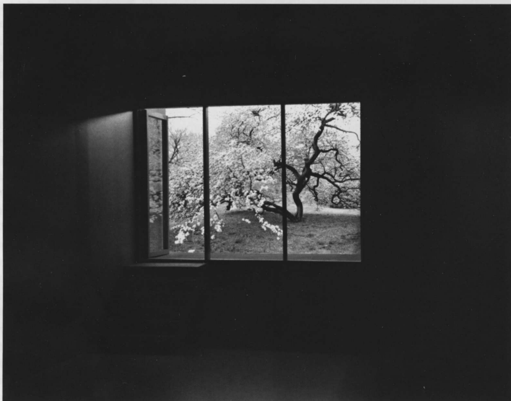
Mayumi Terada, View of blossoms from basement , 2007. Silbergelatineabzug, 61 × 51 cm. Privatsammlung.

nichts Hartes, alles ist weich, harmonisch und fließend, ein zeitloses, perfektes Spiel aus Licht und Schatten. Nicht von ungefähr ist man beim Anblick dieser Fotografien versucht, Altmeister Jun'ichrô Tanizakis (1886–1965) »Lob des Schattens. Entwurf einer japanischen Ästhetik« wieder einmal zur Hand zu nehmen. Wirkt die Textur von Teradas Fotografien nicht wie auf Shoji-Pa-