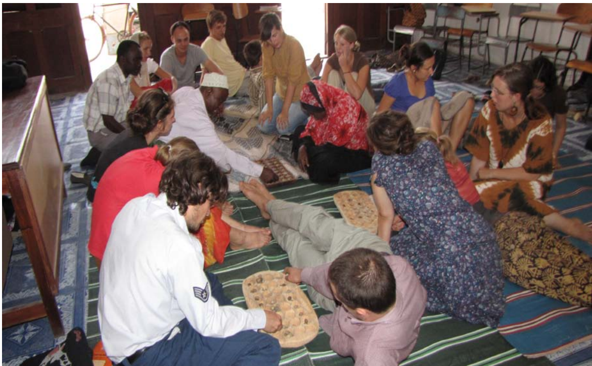
Die Lehrer_innen bringen den Student_innen das Brettspiel Ubao bei